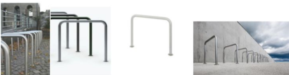
Kaar 1000 bicycle rack (painted and stainless steel in the pictures)

4. attēls Jauno atkritumu urnu un velonovietņu paraugs