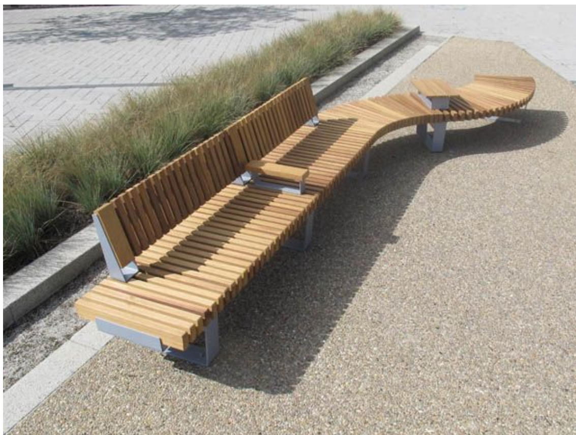
5. attēls Jaunā sola paraugi