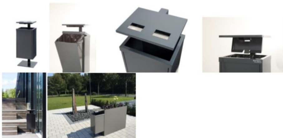
Vandal 75 waste bin

3. attēls Saglabājamie skvēra konstrukciju elementi - solu grupa, galda spēļu grupa, vertikālā vingrotava ar soliem, ping-ponga galds