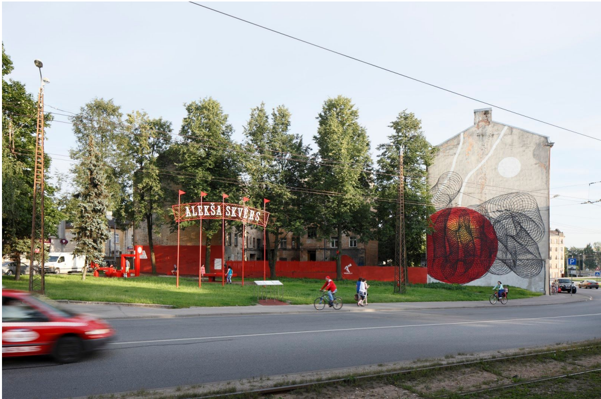
1. attēls Alekša skvēra kopskats (2014)