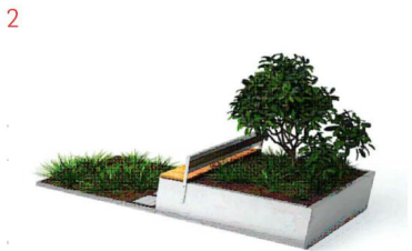
2 Vestra parklet 2.0 cafe modulis 4800x2000 989kg 2 gab.