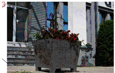
3 Flo betona puķu kaste 1050x1050x900h 280kg 12 gab.